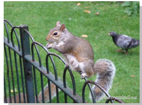
Foto di St. Jame's Park.

St. Jame's Park: È il più antico dei parchi reali, si estende su 23 ettari di terreno. In passato era una palude ma Enrico VIII acquistò il terreno e lo fece diventare una riserva di caccia. Successivamente Carlo II lo trasformò in un vero e proprio parco. Oggi il St. Jame's Park è un posto meraviglioso, con uno splendido lago e una grande varietà di uccelli, anatre, scoiattoli e altri animali che vi abitano oltre a bellissimi salici, fichi e platani che costeggiano la riva del lago nei pressi di Duck Island, una delle due isolette che si trovano all'interno dello specchio d'acqua.